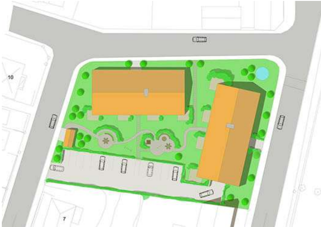
Bild 2. Principiell illustration med placering av nya flerbostadshus utmed Nygatan respektive Järnvägsgatan.

Med infart från Nygatan kan parkering för personer med rörelsehinder anläggas, för att klara Boverkets byggregler kring tillgänglighet om högst 25 meter till entré. In- och utfart till markparkering sker från Villagatan. Möjlighet finns för infart från Järnvägsgatan till källargarage och markparkering. Nygatan behålls enkelriktad och har redan idag mycket låga trafikmängder. Trafiklösningen som helhet säkerställer en god trafikmiljö, god sikt och låga hastigheter.