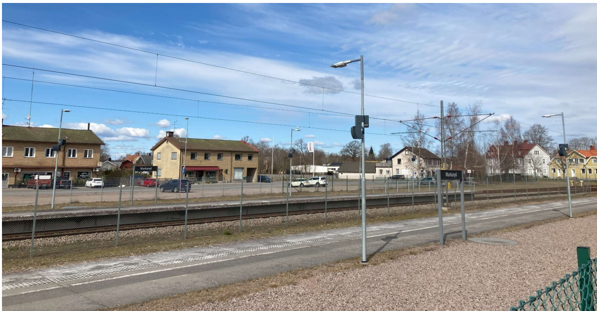
Bild 7. Vy stadsrummet vid järnvägsområdet, i riktning mot planområdet.

De föreslagna nockhöjderna i planförslaget tillåter byggnader i tre och fyra våningar. Den lägre byggnaden placeras mot Nygatan och möter villabebyggelsen i en till två våningar. Det föreslagna fyrvåningshuset kan ge en ny stadsmässighet till stadsrummet vid Järnvägsgatan. Befintlig bebyggelse på östra sidan om järnvägen, järnvägens infrastrukturelement och bebyggelsen vid Järnvägsgatan bildar ett brett och storskaligt stadsrum. Denna breda sektion bedöms tåla ett föreslaget fyrvåningshus utmed Järnvägsgatan.