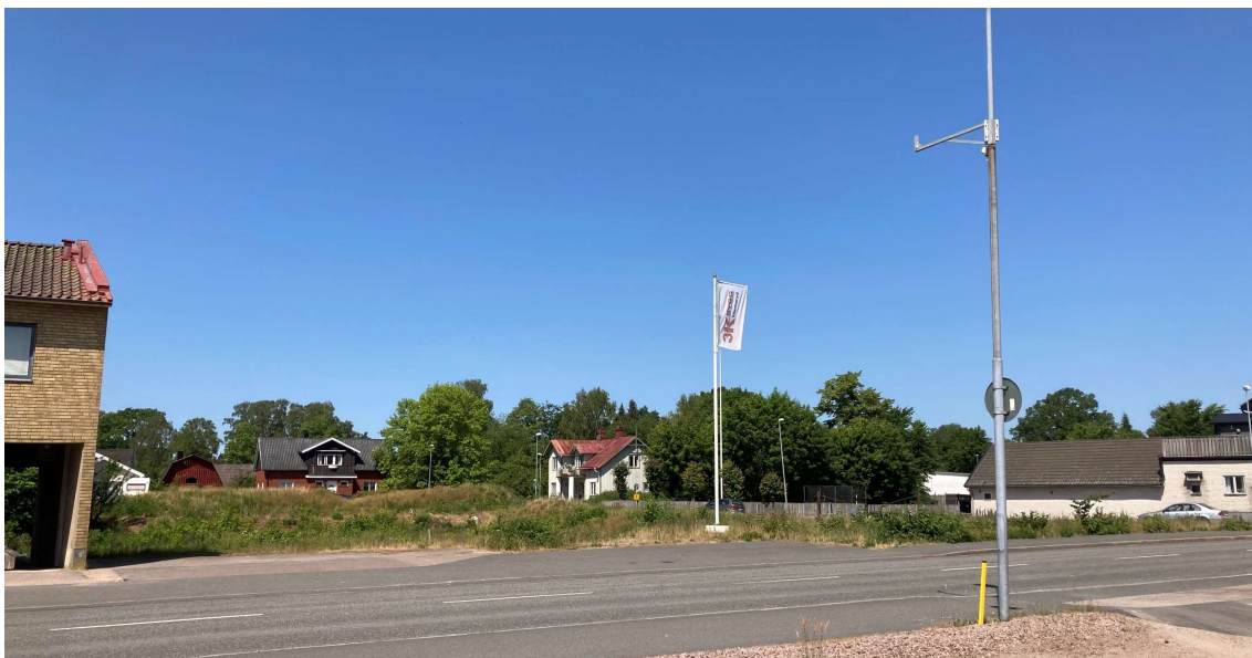
Bild 4. Vy över planområdet vid Järnvägsgatan.

Byggnaderna föreslås placeras i östra respektive norra delen av planområdet. Skuggor från byggnaderna kommer naturligt att falla på gatumark, Nygatan respektive Järnvägsgatan. Balkonger och uteplatser ges goda förutsättningar för söder och sydväst sol. Det har inte bedömts aktuellt att ta fram en separat solstudie.