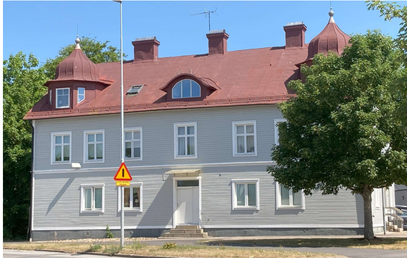
Bild 6. Flerbostadshus från omkring 1900-talets början, Västergatan 4 (östra sidan om Järnvägsgatan).

De föreslagna nockhöjderna i planförslaget tillåter byggnader i tre och fyra våningar. Den lägre byggnaden placeras mot Nygatan och möter villabebyggelsen i en till två våningar. Det föreslagna fyrvåningshuset kan ge en ny stadsmässighet till stadsrummet vid Järnvägsgatan. Befintlig bebyggelse på östra sidan om järnvägen, järnvägens infrastrukturelement och bebyggelsen vid Järnvägsgatan bildar ett brett och storskaligt stadsrum. Denna breda sektion bedöms tåla ett föreslaget fyrvåningshus utmed Järnvägsgatan.