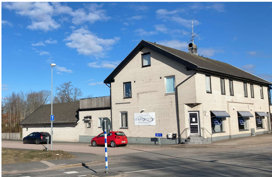
Bild 5. Handels- och flerbostadsbus från omkring 1950-talet, Nygatan 1.

Planområdet ligger centralt i tätorten Markaryd med närhet till järnvägsstationen. Befintlig bebyggelse i planområdets närhet visar på en stor variation vad gäller tidsepoker, stiluttryck, kulörer och material. Huvudbyggnaderna varierar i skala från 1,5 till 3 våningar. Några byggnader bedöms välbevarade vad gäller fasadmateriell, fönstersättning, detaljer etc. Andra byggnader har förändrats över tid.