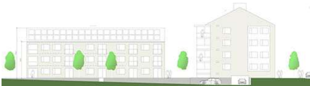
Bild 3. Föreslagna höjder, tre våningar vid Nygatan samt fyra våningar vid Järnvägsgatan.

Motivet med regleringen är att möjliggöra flerbostadshus i 3 och 4 våningar. Byggnaden vid Järnvägsgatan kan uppföras i fyra våningar. Byggnaden i tre våningar vid Nygatan möter villabebyggelsens skala. På del av gården kan carports uppföras till en högsta höjd av 3,5 meter.