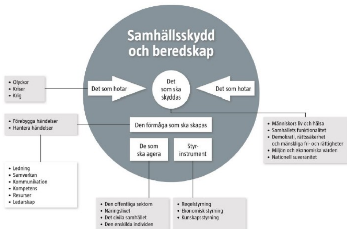
Figur 1. Beskrivning av hur krisberedskap förhåller sig i Markaryds kommun. Figuren är inspirerad av Myndigheten för samhällsskydd och beredskaps (MSB) modellbeskrivning om hur området samhällsskydd och beredskap förhåller sig, MSB (2014) Övergripande inriktning för samhällsskydd och beredskap, MSB708

Med krisberedskap avses i Markaryds kommun, förmågan att förebygga och hantera oönskade händelser, såsom samhällsstörningar och extraordinära händelser. Detta kräver ett aktivt arbete före, under och efter sådana händelser. En oönskad händelse ska tolkas som att den på ett eller annat sätt hotar det som kommunen värdesätter och är av värde att skydda.