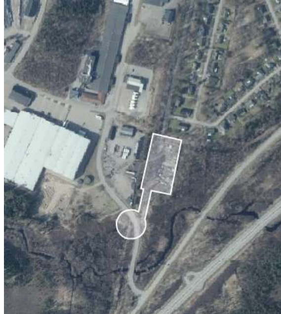
Illustration med förslag på planområdesgräns

Delar av planområdet omfattas idag av befintlig väg (Intäppevägen) inom kvartersmark, koloniträdgårdsområde samt tillhörande parkering. Norr om planområdet finns bostadsbebyggelse. En allmän luftledning korsar planområdet.