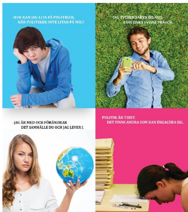
Bild 1. De fyra färgerna. Blå – hur kan jag lita politikerna, när de inte litar på mig. Grön – Jag tycker saker ibland, fast bara i vissa frågor. Vit – jag är med och förändrar det samhället du och jag lever i. Rosa – politik är trist, det finns andra som kan engagera sig.